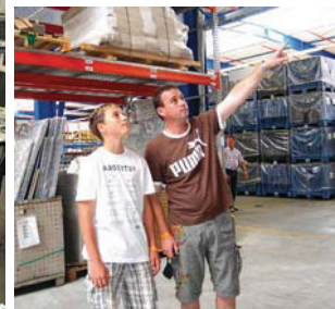
Beim Familienfest zeigt ein Mitarbeiter seinem Sohn seinen Arbeitsplatz.