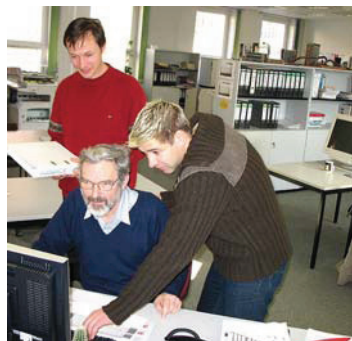
Das Projekt „Junior-Senior“ in der Praxis.